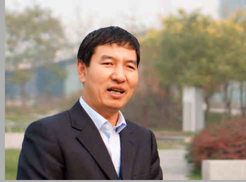
物业经理 天津现代产业园（泰达MSD）